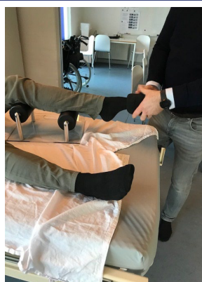
Foto 5: Strømpen påført Doft N' Donner placeres ved borgerens fod.