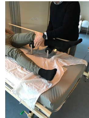
Foto 7: Strømpen føres let hen over rullerne, bemærk kan gøres uden at løfte borgerens ben.