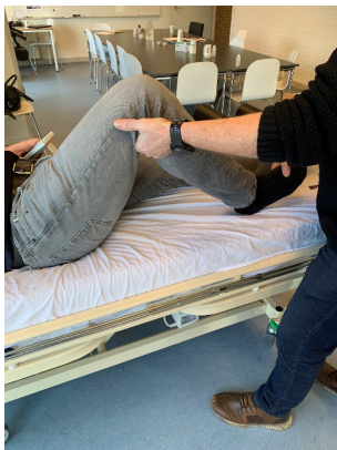
Foto 2: Benet bøjes ca. 90 gr. ved let glidende bevægelse af foden.